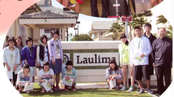
海外語学研修 in ハワイ