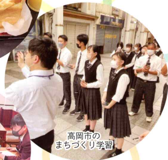
高岡市の まちづくり学習