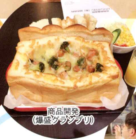
商品開発 (爆盛グランプリ)