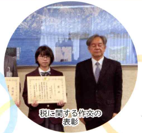
税に関する作文の 表彰