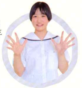
2年 流通ビジネス科 〔石動中卒〕

バレーボールに全力で取り組める環境に進学したい と思い、高商を選びました。毎日の部活では、熱心に指導してくれる先生方、優しく頼もしい先輩方とコミュニケーションを取りながら充実した日々を過ごしています。また、流通ビジネス科では、 営業・販売に役立つスキルを基礎から学んでいます。