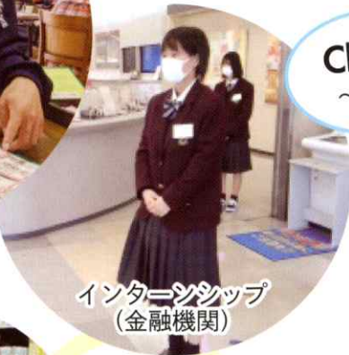
インターンシップ (金融機関)