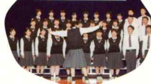
コーラスフェスティバル