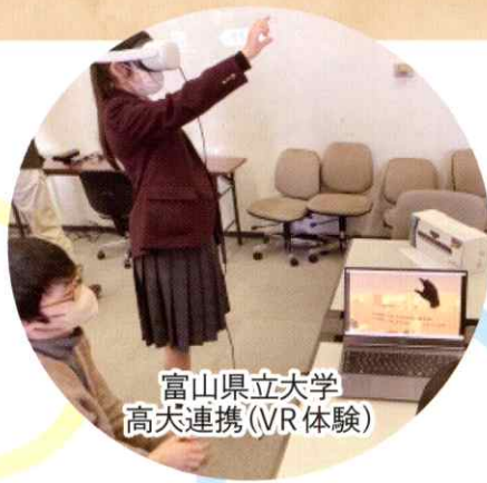
富山県立大学 高犬連携(VR体験)