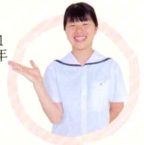
1年 情報ビジネス科 〔大谷中卒〕

高商は、部活動では全員で一致団結をしてそれぞれの試合に勝てるように闘志を燃やしています。勉強では、各科の専門性にそって、集中して勉強に取り組んでいます。高商では中学校まで習うことのなかったことや他の多くの高校では体験できないことを沢山学べる魅力的な場所です。