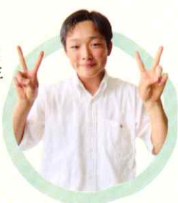
2年 国際ビジネス科 〔芳野中卒〕

高商は 社会に出てから大切なことを高校生のうちから学ぶことができ、 全商の英語検定や簿記検定、情報処理検定等の多くの検定を取得できる学校です。また、 学校行事も盛んで、 体育大会では学年やクラスの垣根を越えて、中学校では体験したことのない種目も楽しめます。