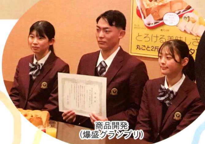
商品開発 (爆盛グランプリ)