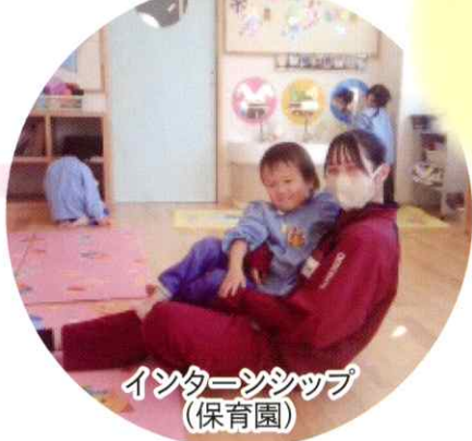
インターンシップ (保育園)