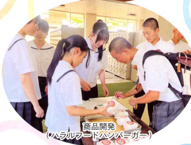
商品開発 (ハラルフードハンバーガー)