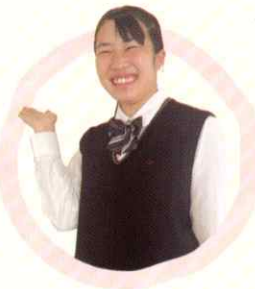
2年 情報ビジネス科 〔庄西中卒〕

この学校には4つのビジネス科があります。商業科目は、 みんなが同じスタートラインから勉強することができます。 また、検定もたくさん取得することができるので、将来進学や就職に役に立つと思います。部活動にも力を入れているので、精一杯練習ができる環境が整っていると実感しています。