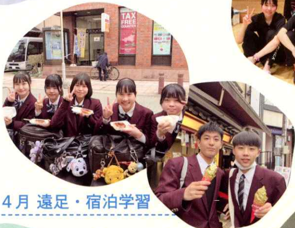
4月 遠足・宿泊学習