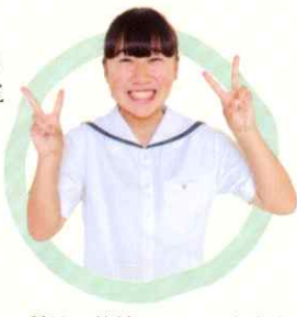
3年 国際ビジネス科 〔中田中卒〕

国際ビジネス科は、他校のALTの先生方をゲストとして行う English camp や 海外・国内語学研修 など英語に特化した学科です。私は、3月に台湾へ行き、観光地を見たり、台湾料理を食べたり、現地の学生と英語で交流したことで、 国境を越えた繋がり を感じることが出来ました。英語が苦手な人も楽しみながら英語を使うことができますよ！