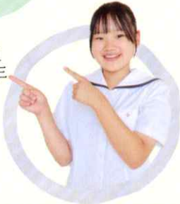
1年 流通ビジネス科 〔津沢中卒〕

高商には県内でも珍しい女子サッカー部があり、部活動でも有名なので全国大会出場を目指して進学を決めました。高商では、 社会に出た時に生かせる人間関係やマナーなど学びます。 商業科目は皆が一から勉強し始めるので今までの勉強が苦手な人でも得意になれるチャンスがあります！