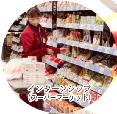
インターンシップ (スーパーマーケット)