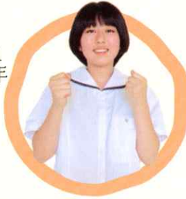
1年 会計ビジネス科 〔南星中卒〕

高商は「文武両道」、その言葉がピッタリな学校です。商業に関する専門的な知識や技術が学べる4学科があり、 全国出場する部活動もたくさんあります。 両立は決して簡単ではありませんが、充実した学校生活を送ることができています。何ごとも全力で取り組むことができ、未来への選択肢が広がる、それが魅力の高商と一緒に文武両道を目指してみませんか？