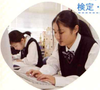
11月 検定・試験勉強