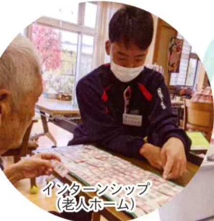
インターンシップ (老人ホーム)