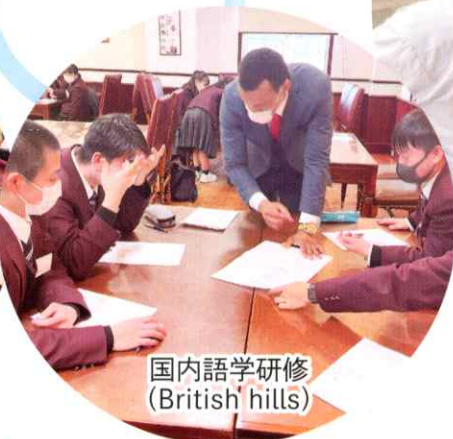
国内語学研修 (British hills)